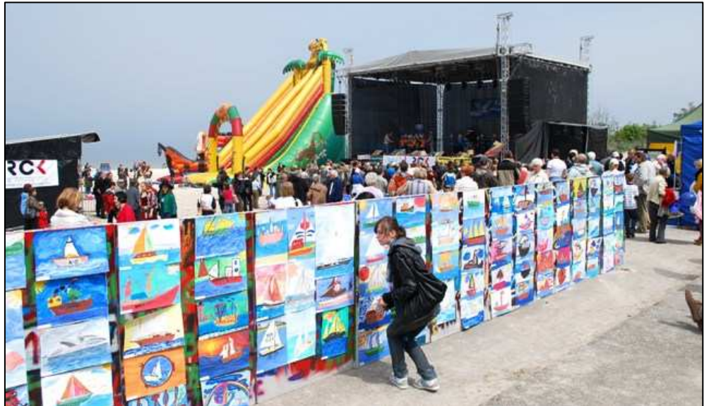
Jako stelażu do ekspozycji prac malarskich użyto muru z zeszłorocznej imprezy „Skok do Europy”